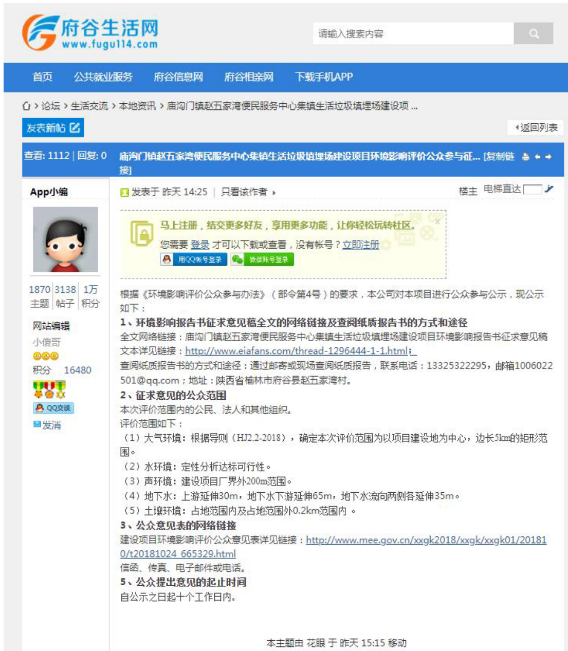
征求意见稿网站公示截图